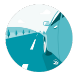
Схема проезда на машине:

Со стороны ул. Тестовская, заезд N5 на наземную парковку ММДЦ «Москва-Сити». Для проезда через шлагбаум необходимо взять парковочную карту (стоимость 200 руб. за первые 2 часа). Двигайтесь по дороге вверх, как ориентир, парковка находится через дорогу от NOVOTEL. Вход в башню Федерация (справа от отделения «Банка ВТБ»).